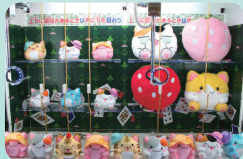
参考景品提供：株式会社 エスケイジャパン