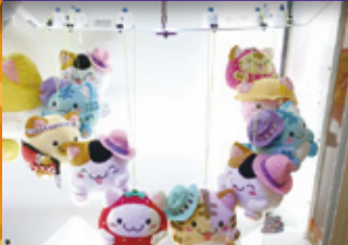
▲ 景品設置にリズムを持たせた配置例

今までは全く異なった空間演出が可能となっており、景品設置箇所、設置数にいたるまで自由に調整が可能です。幅と奥行を自由に使い、景品を設置できます。